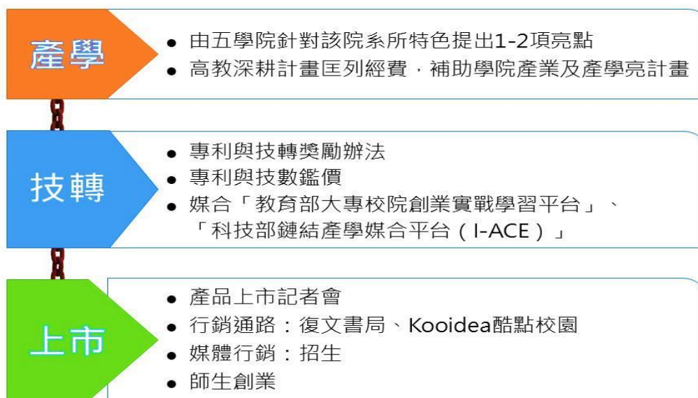
圖 2：四大領域亮點產學發展策略圖

任何人都可以在任何年齡，任何時間，任何地點快樂地學習任何東西。 Anyone can happily learn anything, anytime, anywhere, at any age.